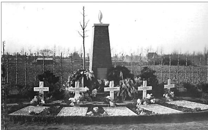
Het herdenking monument (buitenlandse) vliegeniers Tweede Wereldoorlog oude situatie